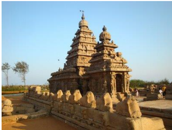
Temples du Rivage

Dîner d'adieu avec remise de cadeaux de remerciement et nuit à l'hôtel.